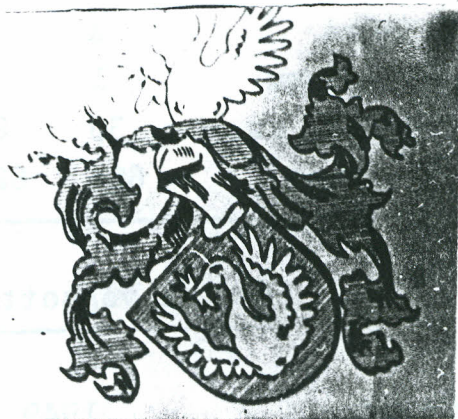
A Rátót - és a Rozgonyi család memesi címere