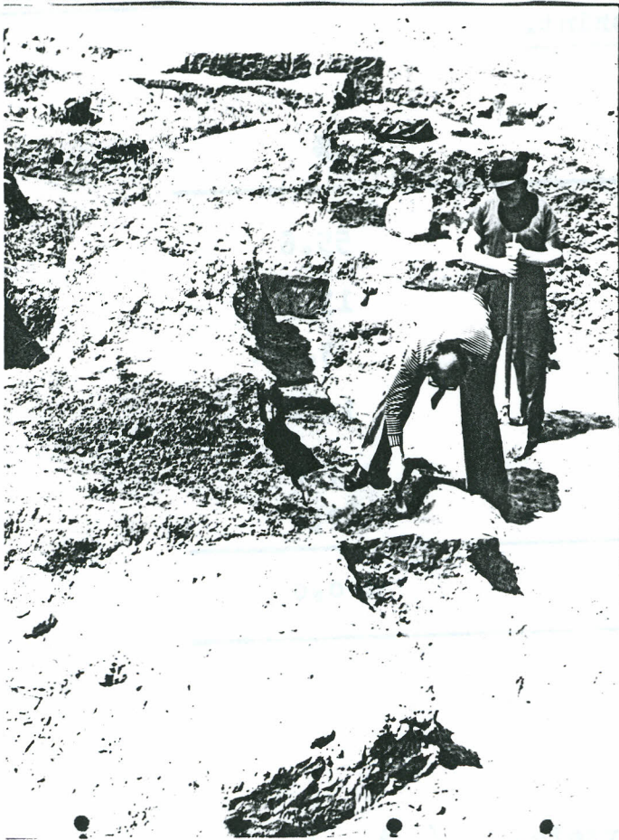
Ivacs falu romjainak feltárása